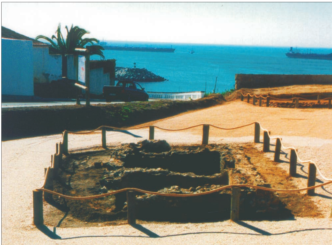
Fig. 13 - Conjunto fabril de produção de preparados piscícolas da época romana do Largo João de Deus.