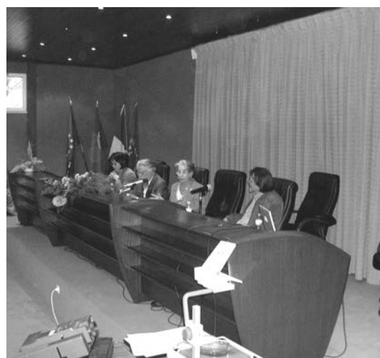
Fig. 4 - Mesa da sessão de encerramento do Simpósio. 8 de Maio de 2004. Intervenção de Françoise Mayet.

Na mesma reunião, participou um público francamente interessado (152 participantes), constituído maioritariamente por estudantes (47,4%), sobretudo de Arqueologia, e por arqueólogos (41,4%), originários da Área da Grande Lisboa Norte (52%), da Península de Setúbal (23%), do Alentejo, Algarve, Centro e Norte do país e de Cádiz. A apreciação que os participantes, não conferencistas, fizeram do evento foi muito positiva, sublinhando a qualidade das conferências, sua abrangência geográfica, a eficiência organizativa e o cumprimento do programa e dos horários.