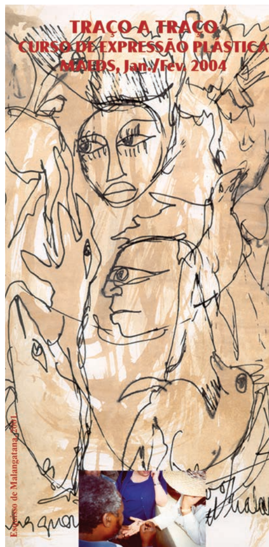
Fig. 2 - Capa do programa do curso de iniciação ao desenho e às artes plásticas, organizado pelo MAEDS em 2004.