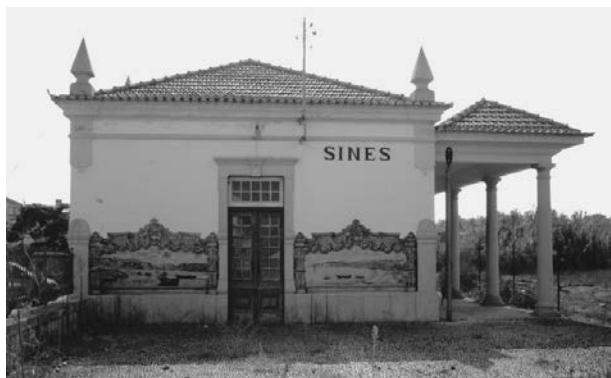
Fig. 4 - Antiga estação da CP em Sines.

3. Visitas de estudo ao património histórico-etnográfico concelhio. No que se refere ao patri-