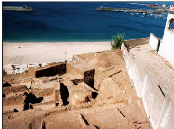
Fig. 12 - Oficina de preparados piscícolas da época romana, recentemente posta a descoberto na Rua Ramos da Costa (2002).

um museu participado pela Comunidade e integrador do património cultural e natural de Sines e das dinâmicas sociais locais foi semeada. Esperemos que frutifique.