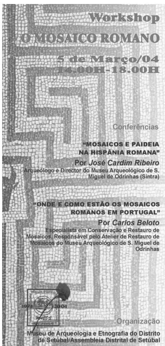
Fig. 3 - Aspecto do desdobrável de divulgação do workshop sobre o Mosaico Romano. MAEDS, 2004.