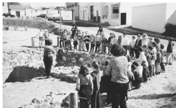
Fig. 3 - Visita com alunos da Escola Básica 1 n.º 1 à oficina de preparados piscícolas da época romana do Largo João de Deus.

(2001/2002), cujos testemunhos materiais representam, pelo seu carácter histórico e monumental, um dos ex-libris da Arqueologia Portuguesa. Encontrase representado em Sines pelo recinto megalítico dos Chãos e ainda pela memória do monumento megalítico da Praia de S. Torpes. Este conjunto de visitas teve como orientador o arqueólogo Carlos Tavares da Silva e o apoio do Museu de Arqueologia e Etnografia do Distrito de Setúbal. Integraram o ciclo de visitas os seguintes arqueossítios: tholos e gruta do Escoural, cromeleque dos Almendres e Anta Grande do Zambujeiro (Montemor-Évora); Anta 2 do Olival da Pega, cromeleque do Xarez, menir de Abelhoa e menir do Outeiro (Monsaraz); menires e cromeleques do promontório de Sagres; necrópole de tholoi e povoado de Alcalar (Portimão), presentemente dotados de centro de interpretação.