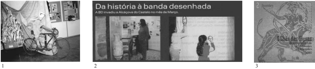
Fig. 7 - Exposições temporárias e itinerantes: 1 Exposição “ Contra o Desperdício: Reduzir, Reutilizar, Reciclar ”; 2 Exposição “ A História do Mundo Através da Banda Desenhada ”; 3 Cartaz da exposição “ O Chão das Musas - O Mosaico no Mundo Romano ”.