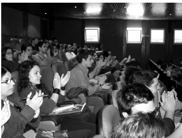
Fig. 6 - Simpósio. 8 de Maio de 2004.

Cada vez mais defendemos que as dinâmicas do trabalho educativo dos museus devem alicerçar-se em investigação própria, e ser orientadas por idéias e problemáticas, tornando-se necessário resistir à “guerra das audiências” e à demagogia de acções genéricas que visam públicos numerosos, abstractos, com pouca capacidade crítica ou sem espaço para a exercerem, em torno de objectos, tornados fétiches. Talvez pelo facto do MAEDS, pela sua dimensão, estrutura organizativa e orçamento, apostar conscientemente na pequena escala, é possível, por um lado, realizar um trabalho mais aprofundado e, por outro, correr riscos, com acções de carácter experimental, sem se deixar seduzir pelo epifenómeno do espectáculo.