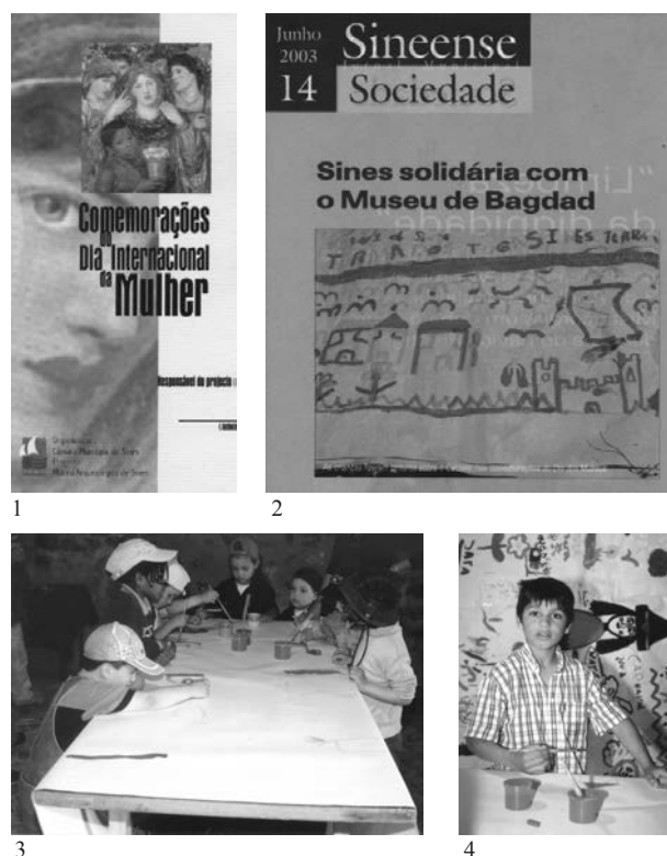
Fig. 11 - Seminários e encontros: 1 Conferência "Mulheres na História, Mulheres sem História"; 2 Debate "Sines Solidária com o Museu de Bagdad"; 3 e 4 Atelier de pintura na alcáçova do Castelo de Sines no âmbito do debate "Sines Solidária com o Museu de Bagdad".

Numa área de 196 m 2 , situada entre a Rua Ramos da Costa e a Travessa de São Sebastião, e limitada a