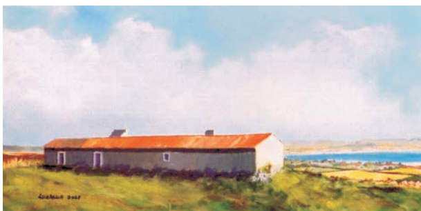
Fig. 1 - Monte da Boavista - Chãos de Sines (acrílico sobre tela de Luciano Costa, 20 x 40 cm), onde poderá vir a ser instalado o centro interpretativo do itinerário arqueológico dos Chãos.

molhos de peixe, datado dos séculos I-V d.C., existente no Largo João de Deus, documenta como o aglomerado urbano da época romana se baseava principalmente na exploração dos recursos marinhos. Foram aí identificadas duas oficinas de preparados piscícolas, completamente escavadas e com elevado valor patrimonial.