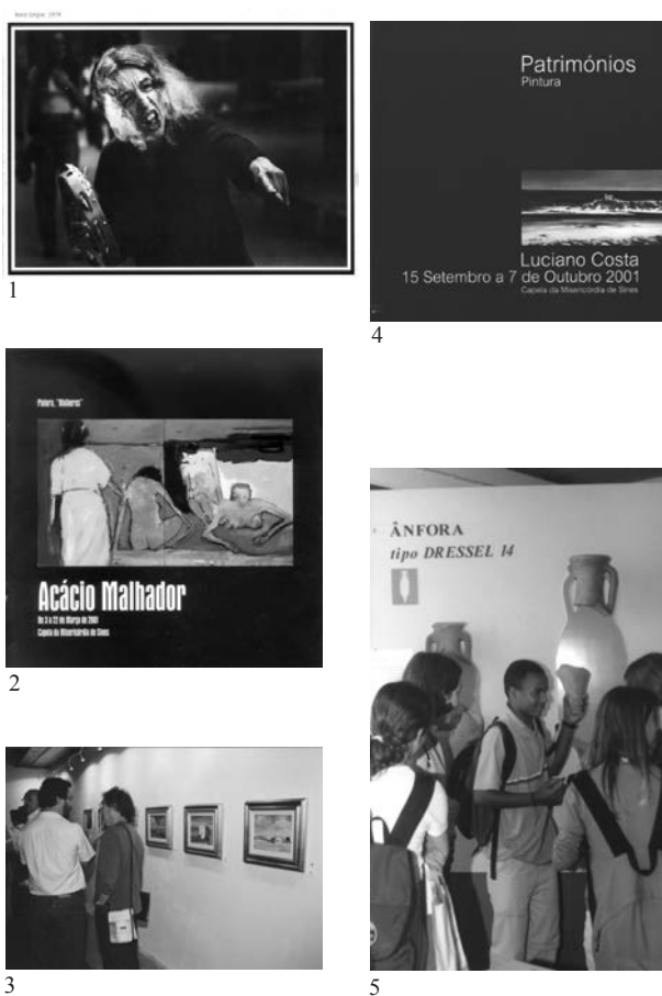
Fig. 6 - Exposições temporárias e itinerantes: 1 “ Mulheres ”, fotografia de Eduardo Gageiro; 2 “ Mulheres ”, pintura de Acácio Malhador; 3 e 4 exposição de pintura de Luciano Costa; 5 visita à exposição “ Os Romanos no Sado ”.

“ Os Romanos no Sado ”, exposição documental