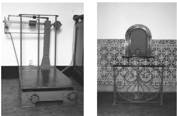
Fig. 5 - Antiga estação da CP em Sines: balança e bilheteira.

mónio com interesse histórico-etnográfico, são de destacar as seguintes visitas guiadas: à antiga estação da CP (edifício que contém no exterior um conjunto de painéis de azulejos referentes a alguns aspectos da história de Sines; recorde-se que o comboio chegou a Sines a 14 de Setembro de 1936); à Corticeira de Sines e ainda à Docapesca.