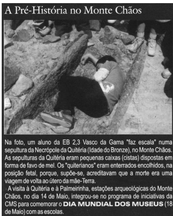
Fig. 10 - Artigo sobre o Dia Internacional dos Museus no jornal municipal Sineense , nº 23 Maio 2002.