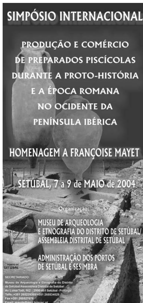
Fig. 1 - Capa de desdobrável da mais recente reunião científica promovida pelo MAEDS.

socioculturais das comunidades que o museu serve e que o suportam), constitui a melhor forma de intervir museologicamente, decorrendo daí a configuração de um determinado perfil museológico.