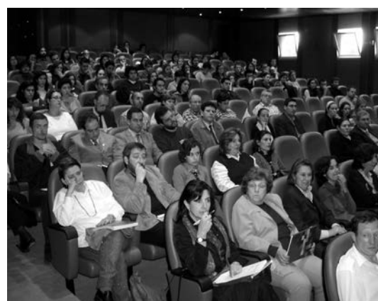
Fig. 5 - Sessão do Simpósio. 7 de Maio de 2004.