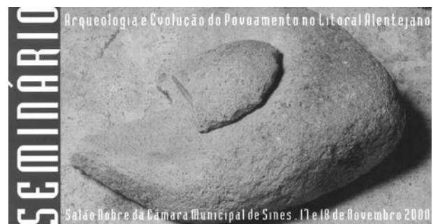
Fig. 8 - Seminário “Arqueologia e Evolução da Ocupação Humana no Litoral Alentejo” (folheto).