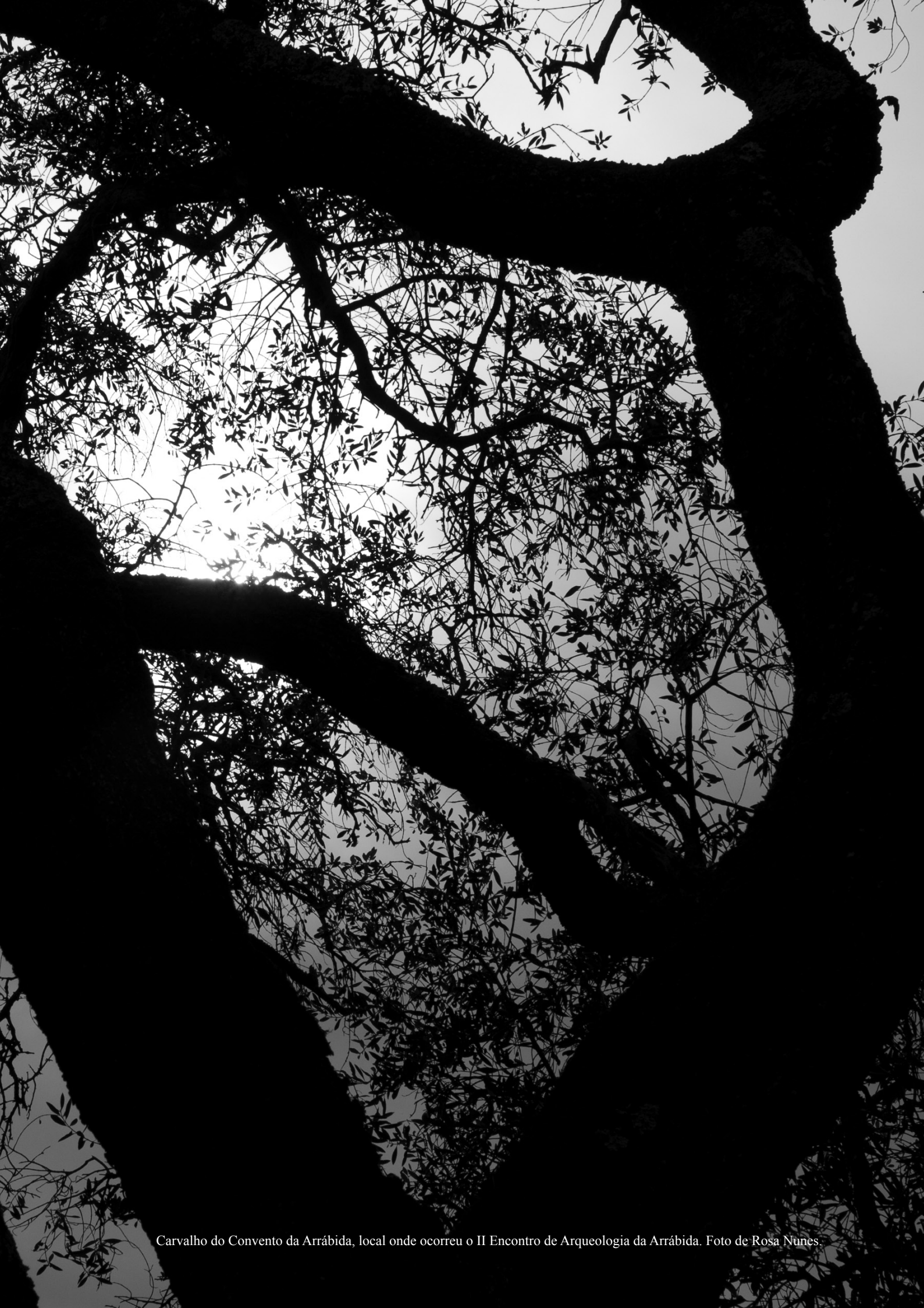
Carvalho do Convento da Arrábida, local onde ocorreu o II Encontro de Arqueologia da Arrábida.