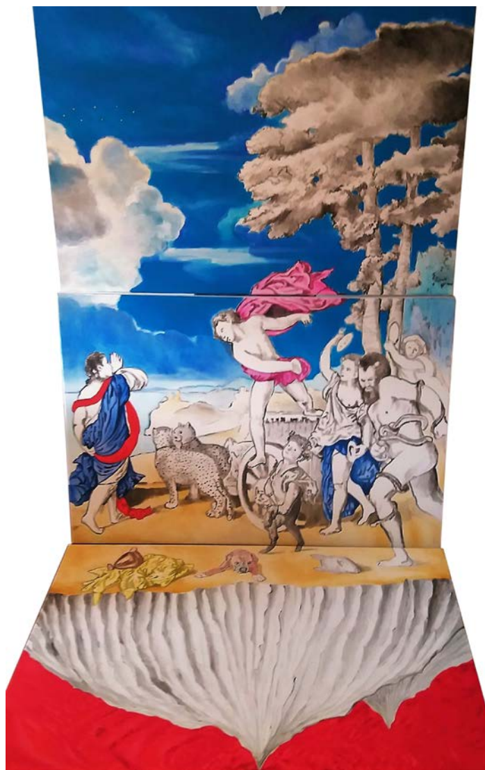
0 Encontro | 2017/18