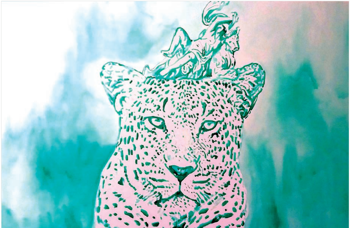
No labirinto | 2017/18