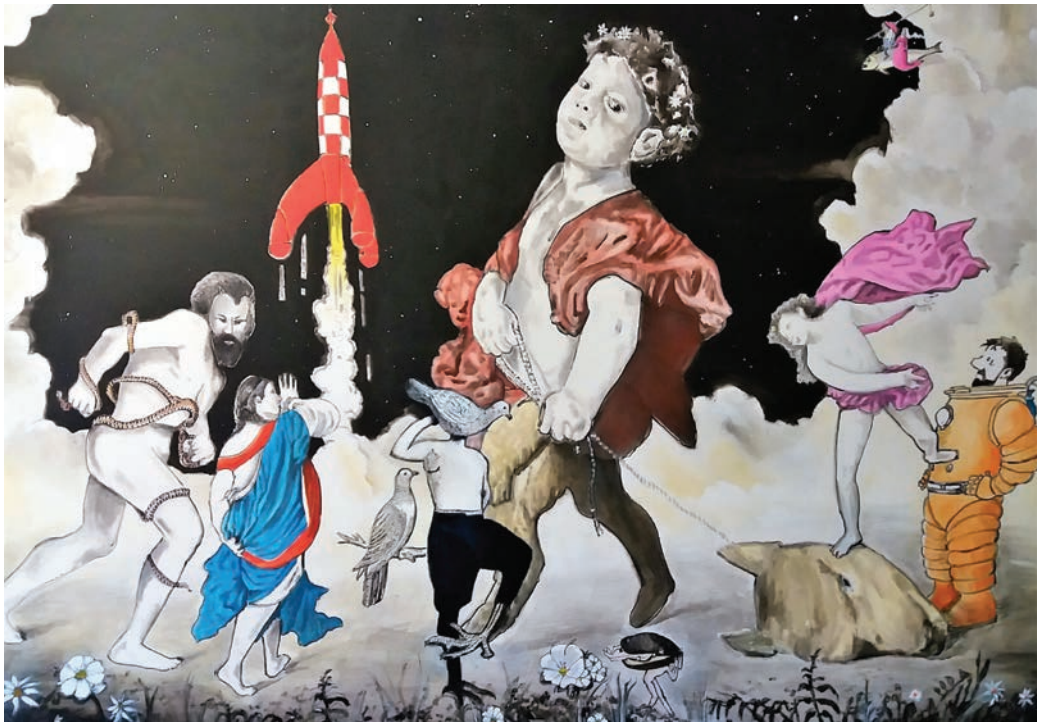
Próximo destino: eternidade | 2018