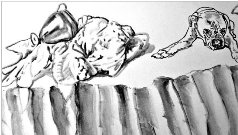
Estudos | 2018