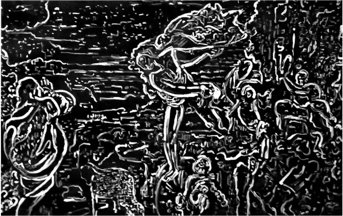
Amor abstrato | 2018