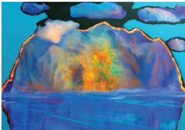
A ilha | 2018